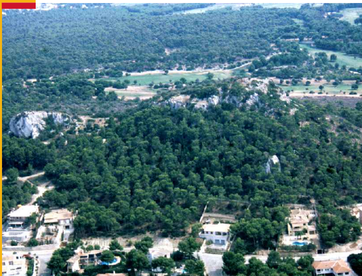
Vista general del Parque Arqueológico de Calvià (Puig de Sa Morisca). General view of the Calvià Archaeological Park (Puig de Sa Morisca). Blick auf den Archäologischen Park Calvià (Puig de Sa Morisca).

El Parque Arqueológico de Calvià - Puig de Sa Morisca, ubicado al lado de la playa de Santa Ponça, con sus 35 hectáreas, ofrece un amplio abanico de ofertas y posibilidades culturales y de ocio.