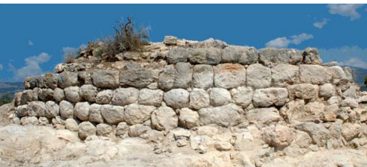
Torre III del Poblado del Puig de Sa Morisca. Torre I del Poblado Puig de Sa Morisca. Turm III der Siedlung Puig de Sa Morisca.

Junto a la riqueza arqueológica y natural, también se encuentran unos interesantes restos etnológicos. Durante los recientes siglos pasados, en el Puig de Sa Morisca hubo explotación forestal y ganadera, por lo que pueden verse en buen estado casetas de carboneros, pastores, roters, etc. El Parque cuenta con nueve conjuntos etnológicos, algunos de los cuales están restaurados y pueden visitarse.