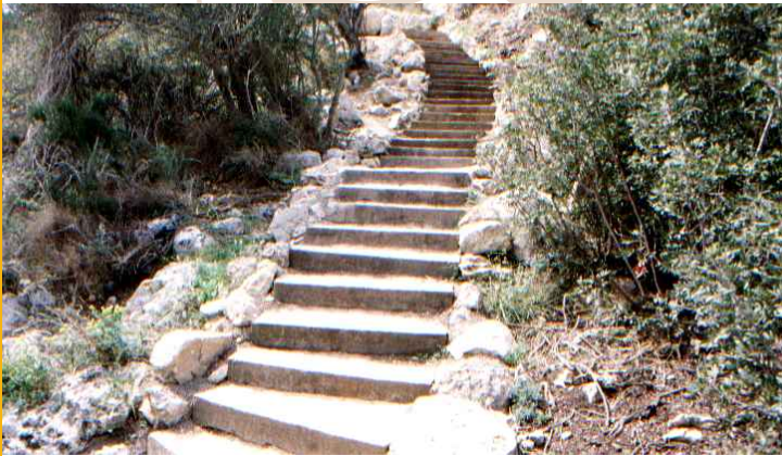
Itinerarios del Parque Arqueológico del Puig de Sa Morisca. Routes in the Puig de Sa Morisca Archaeological Park. Wanderwege im Archäologischen Park Puig de Sa Morisca.

An erster Stelle ist der außerordentliche archäologische Reichtum des Ortes zu erwähnen. Am Puig de Sa Morisca gibt es sieben archäologische Fundstätten, von denen mittlerweile drei besichtigt werden können. Besonders sehenswert ist die Siedlung Puig de Sa Morisca. Zu Fuß gibt es in weniger als 10 Minuten Entfernung neun weitere Fundstätten, die diese Gegend zu einem Fundgebiet von außerordentlichem archäologischem Reichtum machen. Ein Großteil der Funde stammen von der Talayot-Kultur (850 - 123 v. Chr.), weshalb die Besucher dieses Parks die Möglichkeit erhalten, sich eine Vorstellung zu machen, wie diese vorgeschichtlichen Menschengruppen lebten und auch welche unterschiedlichen Strategien sie benutzten, um ihr Gebiet zu kontrollieren und zu verteidigen.