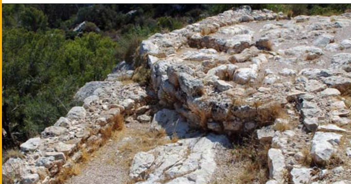
Torre I del Poblado Puig de Sa Morisca. Tower I at the settlement of Puig de Sa Morisca. Turm I der Siedlung Puig de Sa Morisca.

The Calvià - Puig de Sa Morisca Archaeological Park, beside Santa Ponça beach, offers a wide range of cultural and leisure opportunities and possibilities, with its 35 hectares.