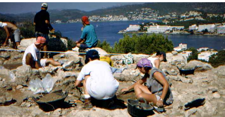
Excavaciones arqueológicas en el Poblado del Puig de Sa Morisca. Archaeological digs at the settlement of Puig de Sa Morisca. Archäologische Ausgrabungen in der Siedlung Puig de Sa Morisca.

Finally, the Calvià - Puig de Sa Morisca Archaeological Park offers some of the best views of the municipality. From some of its viewpoints, almost all the municipality can be seen, from the inland mountainous area, with Puig del Galatzó dominating the horizon, to the coastal areas, more attractive to tourists. As it is a specially protected natural, archaeological area, and because the digging and recovery work is not yet finished, you are asked to fully respect the archaeological remains and the natural environment. Moving earth, moving stones and collecting plants and animals are strictly prohibited.