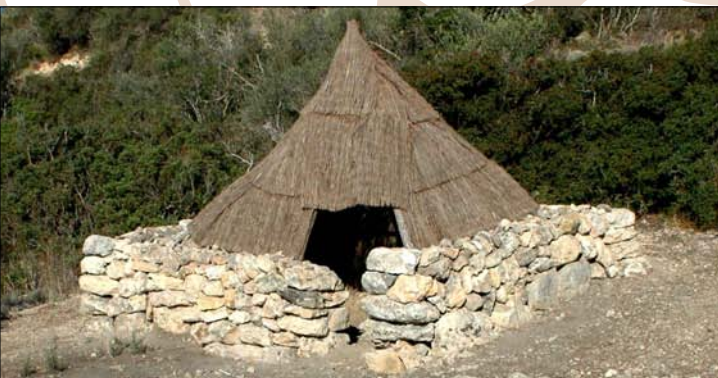
Casa de Carboners. Charcoal burners' house. Haus der Köhler

Der Archäologische Park Calvià - Puig de Sa Morisca bietet den besten Ausblick auf das Gemeindegebiet. Von einigen der Aussichtspunkte öffnet sich fast das gesamte Gemeindegebiet: Man sieht das Inland und die Bergkette mit dem Puig del Galatzó am Horizont bis hin zum touristischen Gebiet der Küste. Da es sich um ein natürliches und archäologisches Gebiet von besonderem Schutz handelt und die Ausgrabungs- und Wiedergewinnungsarbeiten noch nicht abgeschlossen sind, wird gebeten, die archäologischen Reste und die natürliche Umgebung zu respektieren. Das Entfernen von Erde, das Bewegen von Steinen und das Sammeln von Pflanzen und Tieren sind strengstens verboten.